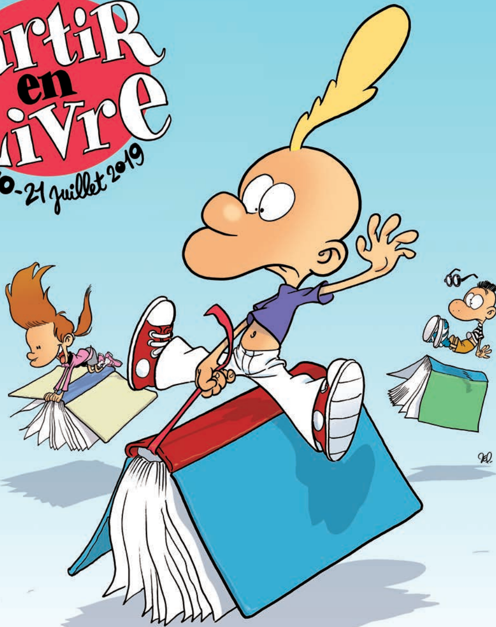
Illustration : Zep pour Partir en Livre 2019