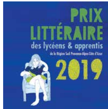
© Jérôme Ruillier Conception graphique : Julie Brandino

La Région Sud dote désormais tous les lycées et CFA de son territoire d'un jeu des 2 titres primés (roman et BD) l'année précédente par les jeunes dans le cadre du Prix littéraire des lycéens et apprentis. À cette fin, la Région Sud a imaginé un présentoir dédié permettant la mise en valeur de ces ouvrages dans tous les CDI des établissements de la région.